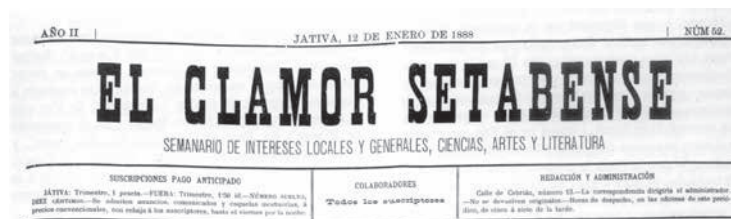
Capçalera de El Clamor Setabense (12/1/1888)

palpable” de Xàtiva “en su estado moral y material”. Raciocini no exempt de certa actualitat en alguns aspectes.