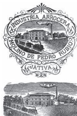
Anunci publicitari d'un molí d'arròs de Xàtiva. Materials xilogràfics de Blai Bellver

de força i “la instrucció, como punto de apoyo”. Un plantejament que Pascual Cuquerella, es mostrava disposat a seguir per tal de col·laborar en la consecució d'allò que, al seu parer, Xàtiva necessitava 11 .