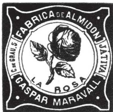
Anunci publicitari d'una fàbrica de midó de Xàtiva. Materials xilogràfics de Blai Bellver