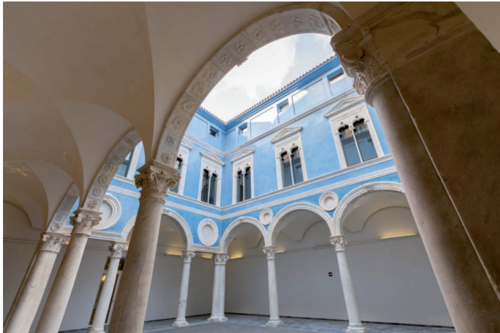
Figura 11. Antonio de Sangallo el Jove? / Jacopo Sansovino? Columnnes renaixentistes del palau dels Vic Museu de Belles Arts de València