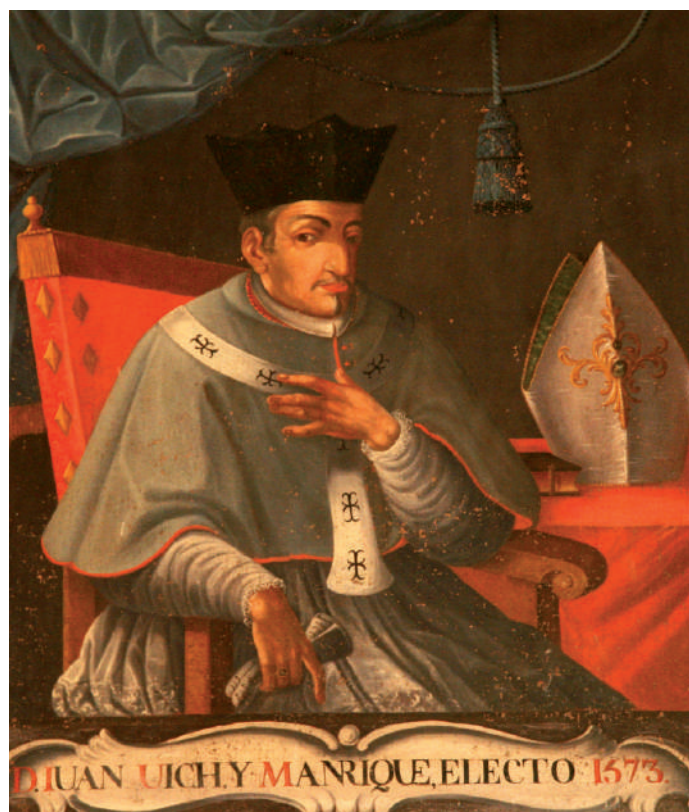
Figura 1. Anònim. Retrat del bisbe de Mallorca Joan Vic i Manrique de Lara Palau episcopal de Mallorca