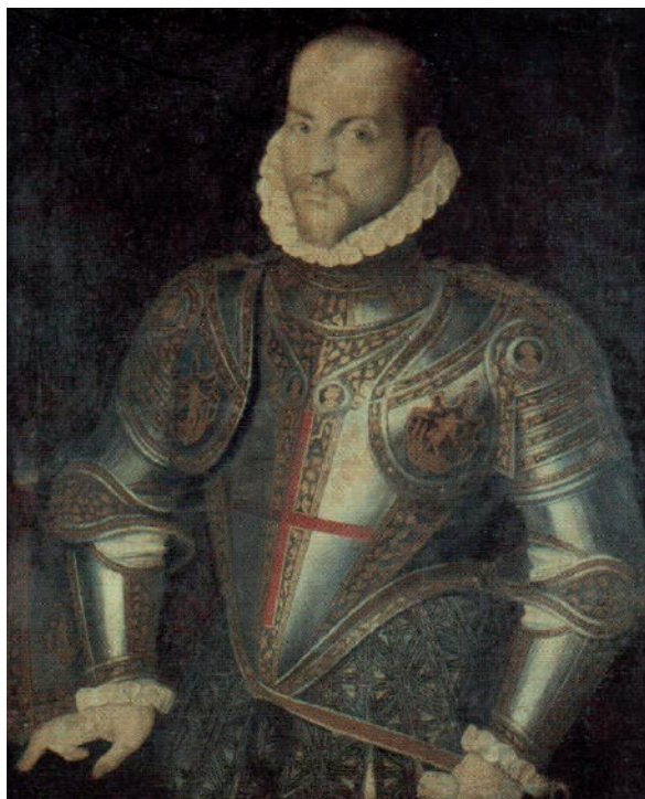
Figura 7. Roland de Moïs: Retrat de Jordi Vic i Manrique . 1581 Museu de Belles Arts de València