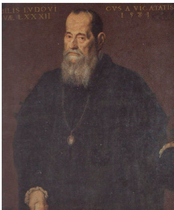
Figura 3. Roland de Moïs: Retrat de Lluís Vic i Ferrer . 1581 Museu de Belles Arts de València