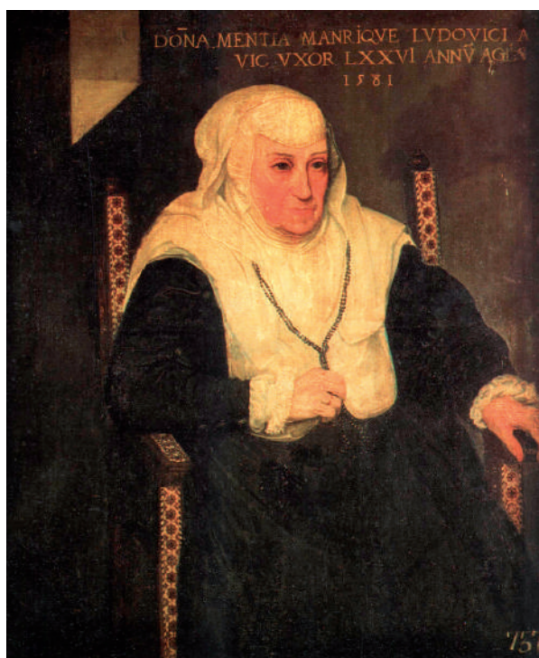
Figura 4. Roland de Moïs: Retrat de Mencía Manrique de Lara . 1581. Museu de Belles Arts de València