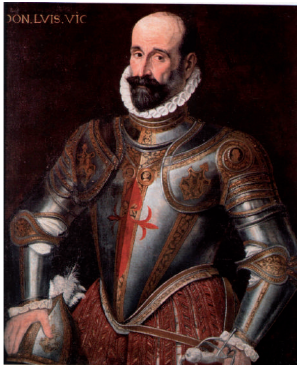
Figura 6. Roland de Moïs: Retrat de Lluís Vic i Manrique . 1581 Museu de Belles Arts de València