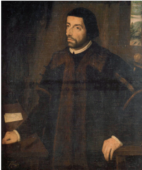
Figura 5. Roland de Moïs: Retrat de Joan Vic i Manrique . 1581 Museu de Belles Arts de València