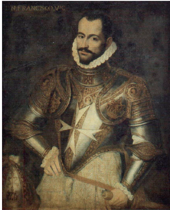
Figura 9. Roland de Moïs: Retrat de Francesc Vic i Manrique . 1581. Museu de Belles Arts de València